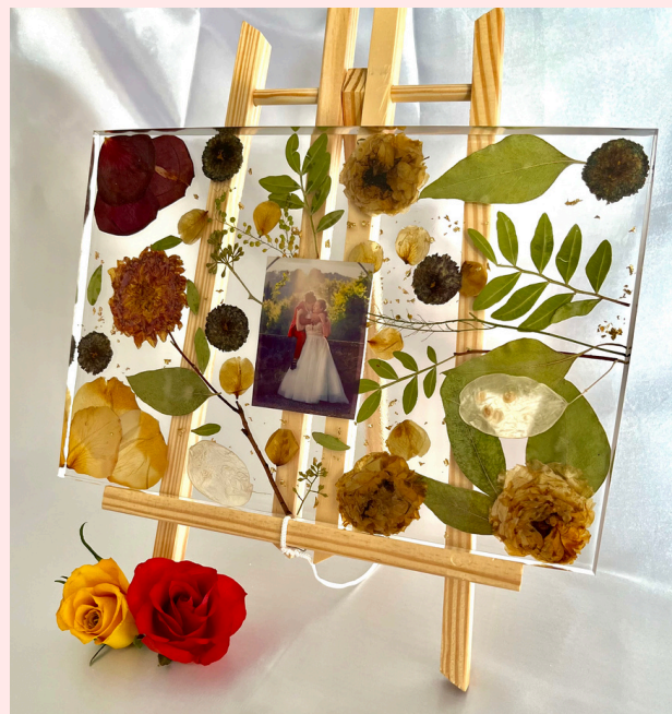
Tableau en résine : Les fleurs de ton bouquet sont pressées pour être disposées dans de la résine comme tu le souhaites. Je peux y ajouter des éléments supplémentaires comme des feuilles d'or, or rose ou d'argent. Le format disponible est 20*30cm.